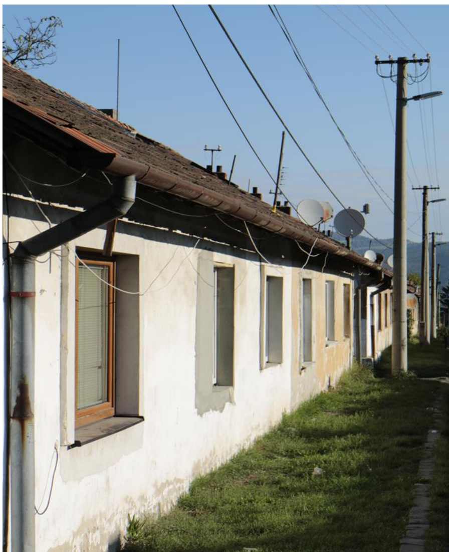
Obrázok 3 Radová zástavba v lokalite

Takmer každá domácnosť je pripojená na elektrickú energiu. Tí, čo majú dlh voči dodávateľom napoja si elektriku svojpomocne na suseda. V lokalite baníckej kolónie 100% domácností vykuruje pevným palivom (drevom, briketami).